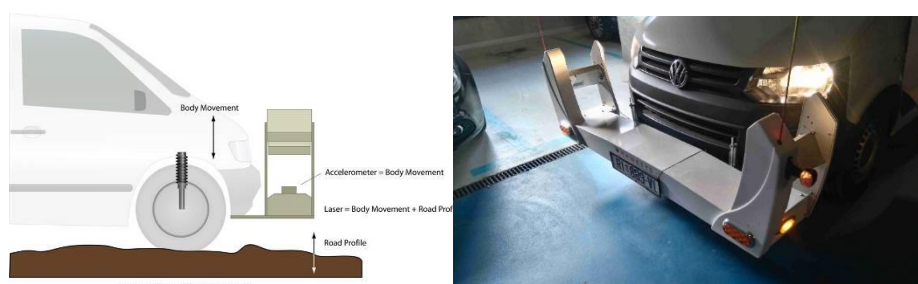
Slika 2. Prikaz mjernog vozila Hawkeye 2000

Na odabranim karakterističnim lokacijama mjereni su tehnički parametri ravnosti u desnoj i lijevoj putanji kotača. Za potrebe rada analizirala se srednja vrijednost indeksa ravnosti. Mjerene vrijednosti i ocjena stanja s obzirom na ravnost je prikazano u Tablici 2.