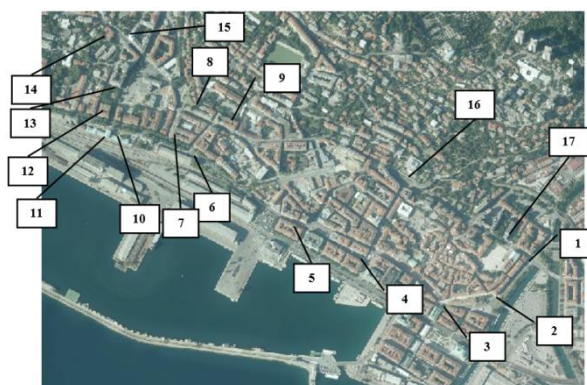
Slika 1. Ortofoto prikaz analiziranog područja [6]

Cestovna mreža u užem području grada ograničena je postojećom izgradnjom. Za potrebe ovoga istraživanja obuhvaćene su autobusne postaje u prometno najopterećenijoj zoni grada, unutar šireg centra grada Rijeke, položaj analiziranih stajališta je vidljiv na Slici 1.