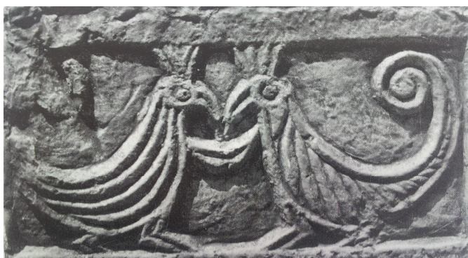
Slika 5. Fragment oltarne pregrade crkve sv. Petra u Zavali; rekonstrukcija

Crkva Sv. Petra u Zavali nije, kao omizka, imala tu sre u ostati o uvanom u svom stereometrijskom volumenu, te posvjedo iti o rustikalnoj snazi starohrvatskog graditeljstva u najbli0em zale u Jadranskog mora. Usprkos tomu, onako u oskudnim ostacima sredznjeg i apsidalnog zi a, ova gra evina uspijeva uvati analogiju sa arhitektonskim programom koji se u to doba razvijao u ju0nom i srednjem dijelu isto ne obale Jadrana. Prilog tomu su prona eni dijelovi oktogonalnih stupova koji sugeriraju mogu nost da su bili dijelom potporne strukture kupole, te ostaci pleterne strukture na fragmentima oltarne pregrade, ornamenti koji kriptogramski zalju svoju umjetni ku poruku sa hercegova kog krza iz doba razvoja prve hrvatske dr0ave. Upravo ova potonja, dekorativna plastika, prije svih velika plo a sa tropleternom zastavicom i prikazom ptica u paru, pa i dvije manje plo e na kojima su tako er modelirane ptice uz prikaz euharistije, upu uju na iskonsku snagu osnovne teme plasti ne obrade u kamenu arhitektonskih elemenata starih Hrvata.