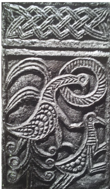
Slika 6. Prikaz reljefa sa pluteja crkve sv. Petra u Zavali; rekonstrukcija

Regionalnu pripadnost jednobrodnom kupolnom tipu crkva u Zavali ima zansu potvrditi i usporedbom sa crkvom Sv. Ilije na Lopudu, ija je apsida tako er pravokutna i sa vanjske i svoje unutarnje strane; povijesna je koincidencija da i lopudska crkva nije sa uvala svoju kupolu.