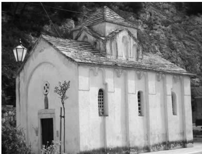
Slika 4. Crkva sv. Petra, Omiz

Omizka crkvice u sjajno o uvanoj jasno i svoje pojavnosti zorno pokazuje tipološke odlike ovoga arhitektonskog tipa gra evina iz starohrvatskog razdoblja (slika 4); tri su tu traveja, u ovoj sadr0ajno i strukturalno zadanoj kombinaciji uzdu0no i centralno odre enog prostora, od kojih srednji le0i u sjeni nevelike kupole . arhitektonskim rje nikom do aranog snebeskog pokrova%Apsidalni je prostor u svojoj unutrašnjosti determiniran polukru0jem tri nize, dok je njegova vanjztina zatvorena strogom geometrijom etverokuta.