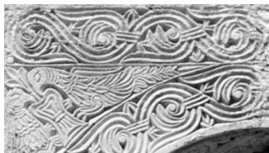
Slika 3. Crkva Sv. Mihajla kod Stona, detalj okvira prozora na ju0nome zidu

Spomenuta usporedba stilskih odlika reljefa nadvratnika na portalu ninske crkvice sa onima na okviru prozora sa za elja crkve Sv. Mihajla pored Stona ne temelji se samo na pojavnosti motiva troprute vrpce; prikaz dviju ptica koje uzimaju vodu iz kale0a je likovni obrazac koji ima euharistijsko zna enje od doba ranog krz anstva (slika 3).