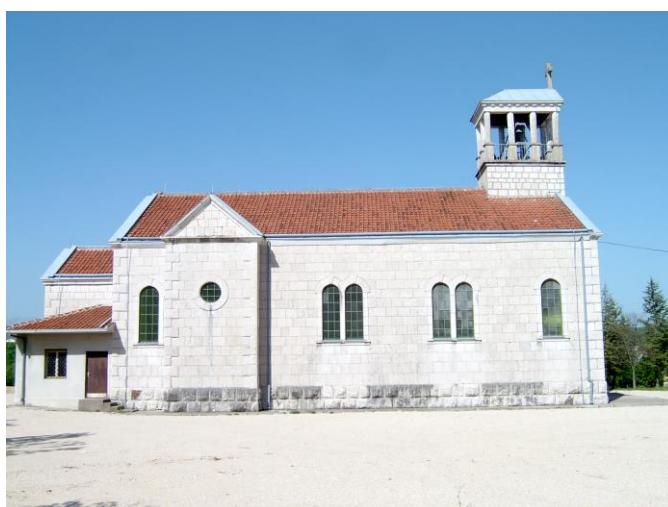
Slika 7. Bočno pročelje rašanjske crkve

Crkva ima dvostrešni drveni krov koji se oslanja na drvenu konstrukciju stropa. Strop je bačvasti s lučnim daščanim remenatama na razmaku od oko 100 centimetara kao glavnim nosačima. Remenate su ujedno i oslonac podrožnicima krovne konstrukcije. Ušteda je razlog ovakvoga neuobičajenog načina rješavanja krovne konstrukcije. Zbog toga je krov izrađen bez očekivanih kosih "stolica" za koje je potreban veći prostor između stropne i krovne konstrukcije. Taj bi prostor povećao visinu crkve i tako je dodatno poskupio. Na dijelu krova iznad kora, gdje nema stropa, izvedena je klasična stolica kao oslonac krovnoj konstrukciji. Ispod stropa u srednjim trećinama lađe izrađene su čelične zatege od glatkih armaturnih šipaka profila 25 milimetara koje su usidrene u armiranobetonski vijenac zida.