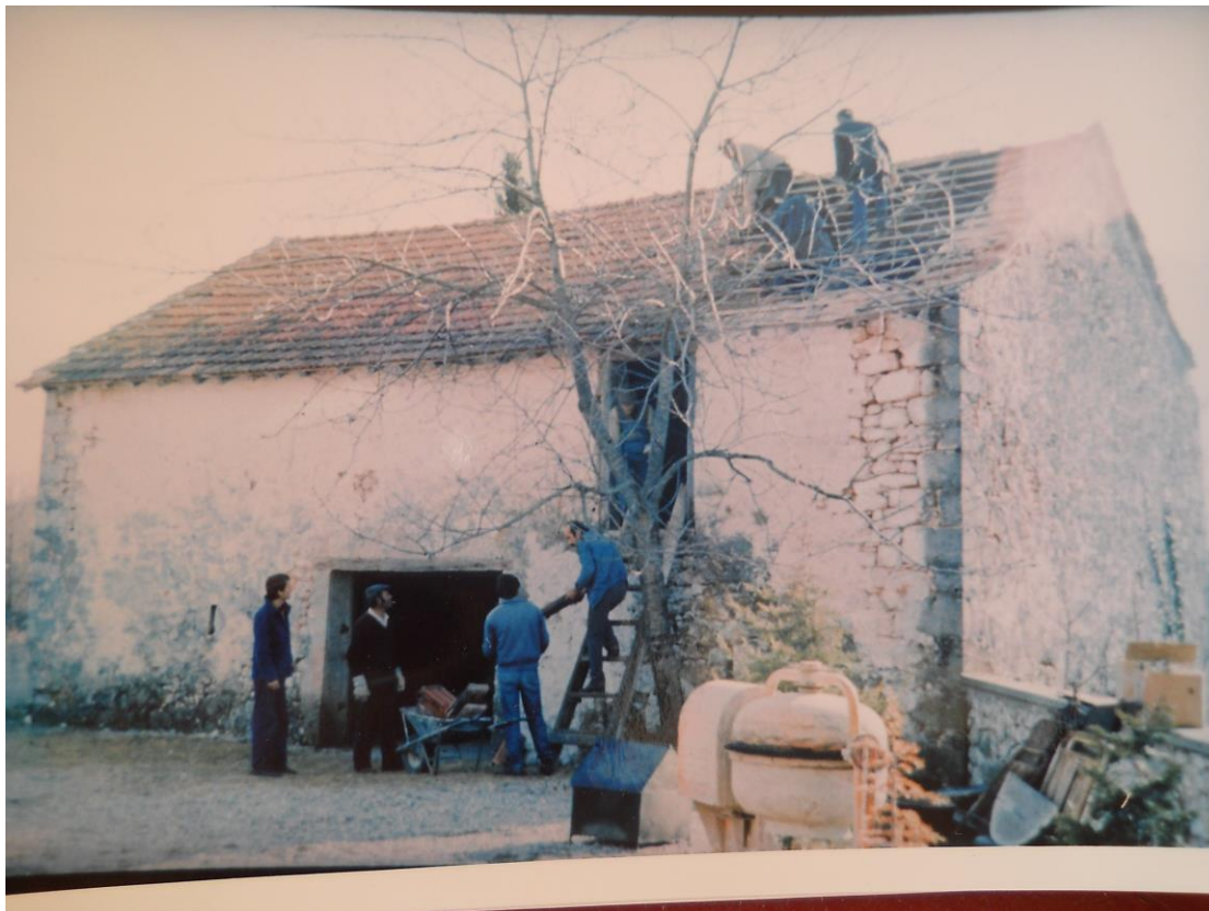
Slika 1. Stara župna kuća porušena 1985.

Nekoliko je godina kasnije ova stara župna kuća pretvorena u gospodarsku zgradu (štalu) koja je s vremenom postala vrlo trošnom. U njoj su za vrijeme Drugoga svjetskog rata klesari klesali kamen za župnu crkvu. Porušena je za župnikovanja fra Drage Pažina 26. veljače 1985. Nešto je ranije porušena i kuhinja koja se nalazila između stare i nove župne kuće.