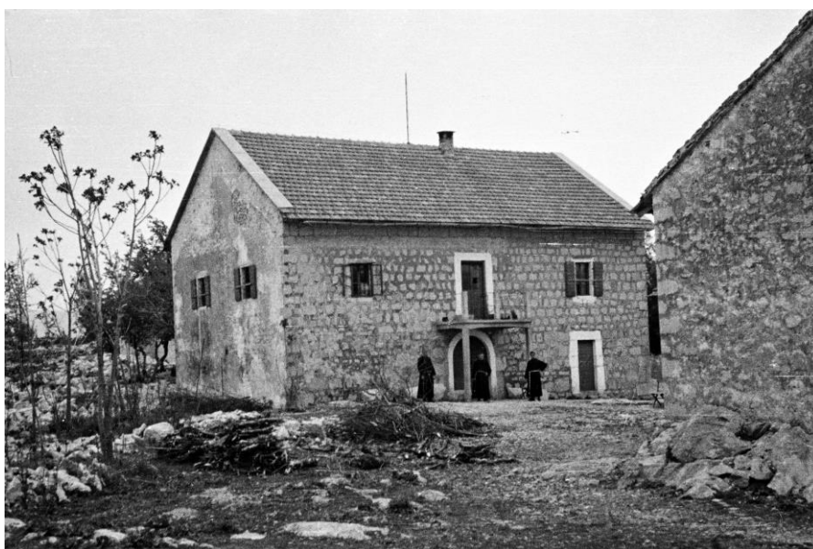
Slika 2. Stara župna kuća s kapelom (podignuta 1883.-1892., a obnovljena 1970./1973).