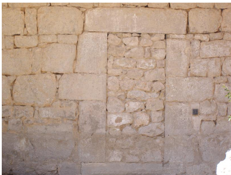
Slika 3. Novootkriveni ulaz u staru kapelu u sklopu nove župne kuće