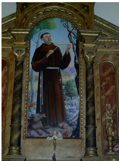
Slika 9. Glavni oltar prenesen iz stare crkve na Humcu

Od umjetnina u crkvi vrijedi istaknuti drveni oltar neoklasicističkog stila koji je donesen iz samostana na Humcu 1961. godine. Ovaj je oltar vjerojatno na Humac dospio iz Zagreba kao dar sestara Milosrdnica. Oltarna je slika djelo fra Mirka Ćosića. Od ostalih umjetnina vrijedi izdvojiti drveni kip sv. Franje, zaštitnika rašanjске župe. Kip je visok 170 cm i djelo je tirolskog kipara Ferdinanda Sutlessera. Vjerojatno je nabavljen nedugo nakon osnutka župe.