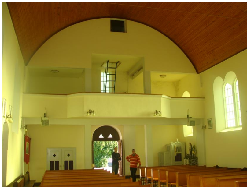
Slika 8. Pogled na ulaz i kor

Zvonik crkve visine 16,40 metara dosta je nespretno izveden. Na njemu je zvono težine 350 kilograma pribavljeno 1988. godine. Sve do tada je zvono visjelo na gredama pokraj župne kuće. Staro je zvono kupio prvi župnik fra Ilija Leko i bilo je teško tek 5 kilograma. Drugo je zvono bilo dar fra Franje Brkića, misionara na Kosovu. Ono je puklo i odslužilo svoje. Sadašnje crkveno zvono elektrificirano je 1994. godine.