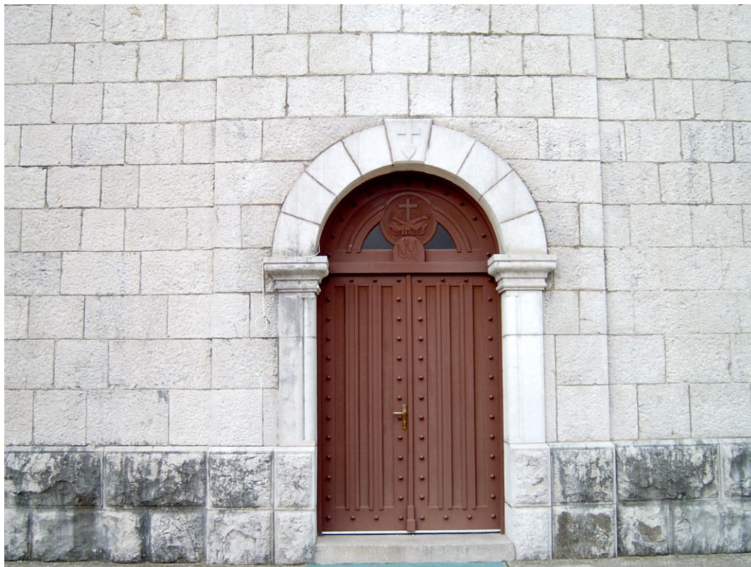
Slika 5. Glavni ulaz u crkvu

Rašanjnska je crkva skladna gradnja križnoga tlocrta kao na slici 5, a njezina orijentacija je istok-zapad. Duljina crkve iznosi 25,80 metara. a širina 11,35 metara. Polukružna je apsida dimenzija 5,60 metara sa 4,40 metra. Dvije postrane kapele su u stvari jednostavne niše širine 90 centimetara. Crkva ima betonski kor širine 3,75 metara. Zidovi crkve debljine 75 centimetara su dvoslojni. Unutarnji je sloj sazidan od lomljenoga lokalnog kamena vapnenca u vapnenom mortu, dok je vanjski izrađen od pravilno klesanoga pravokutnog kamena. Skoro cijeli vijenac izgrađen je od kamena izuzev dijela koji je 1958. godine betonski nadograđen. Također je od armiranog betona i polukružni zid iznad kora kojim je zatvoren bočni dio stropne konstrukcije.