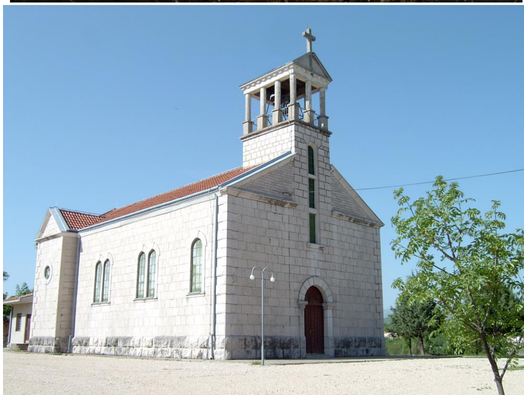
Slike 10.-11. Sadašnji izgled crkve sv. Franje na Rasnu, Grad Široki Brijeg