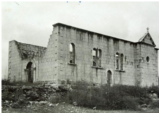
Slika 4. Crkva u gradnji, 1941. godine