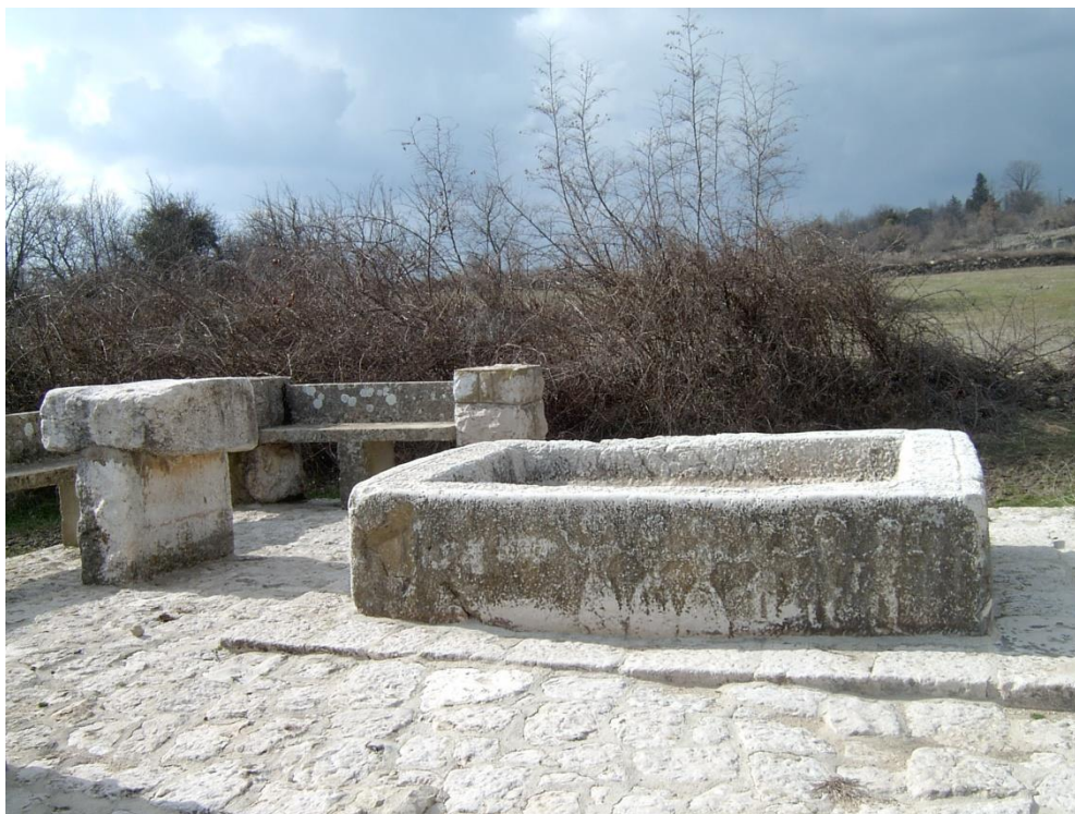
Slika 8. Kameno korito s ukrasom u Hamzićima, Čitluk

Korito je obično sastavni dio zdenca ili čatrnje (cisterne). U gornji dio čatrnje skupljala se kišnica ili snijeg. Donji dio, korito, služilo je za napajanje blaga. Korita iz Hercegovine nemaju oblik uobičajenih kruna u primorju, jer nije prošupljeno i nema rupu kroz koju se crpi voda iz čatrnje. Rijetka su pojava da korita imaju ukrase ili natpise. Nažalost, neka od korita nastala su od stećka, tj. da je to prvobitno bio stećak, koji je naknadnim klesanjem preuređen u korito denac (tur. bunar) je vrutak žive, bistre i hladne vode u bezvodnim predjelima. Trebalo je znati na kojem mjestu se može zdenac iskopati. Tu je pomoglo višestoljetno iskustvo, utemeljeno.