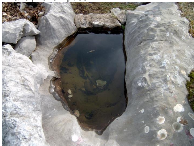
Slika 9. Kamenice – udubljenje kamenu

Kamenice su prirodne nakupnice za vodu, Božji dar i ljudima i životinjama. Znali su i jedni i drugi za svaku veću kamenicu u nekoj ogradi, uz kozje putove ili pak u šikari. Znali su i, da se ne zaboravi, znanje o njima prenosili iz naraštaja u naraštaj. Iz njih su pili putnici, težaci, pastiri i njihova stada. Danas je presušilo znanje, a iz kamenica piju samo gmizavci, kukci i ptice.