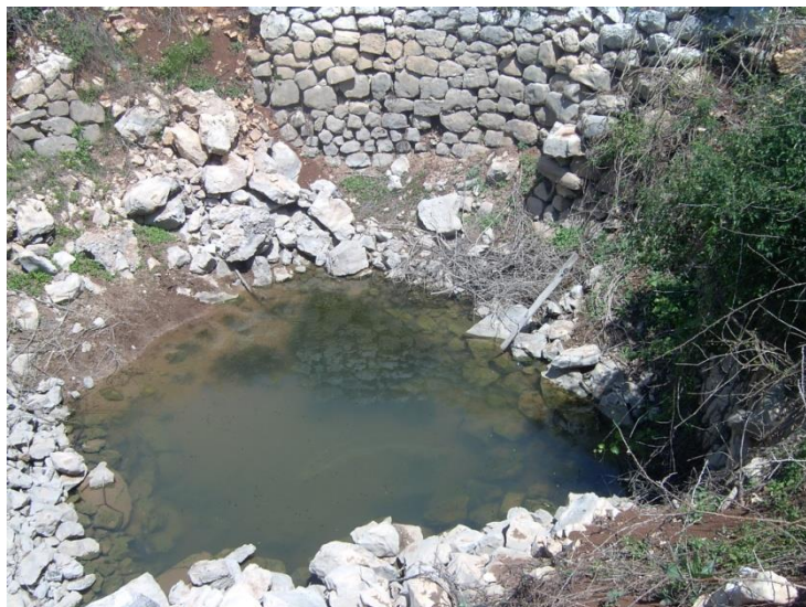
Slika 11. Lokva u ruševnom stanju

nestale zauvijek zbog neznanja, dobre namjere i želje da im se ušminka lice. Nakon nepropisne šminke, odnosno nakon što su uredno ostrugane i očišćene od korova, a zbog nedostatka domaćih životinja, njihovih kopita i papaka, lokve su se pretvorile u prazne jame. Izgubile su se same u sebi, u svom mekom licu, i prerasle u ledine na kojima raste i vene samo trava prošarana cvijećem.