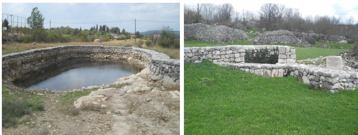
Slika 12. Obnovljena lokva Krgača i bunar Bistirna u Rasnu