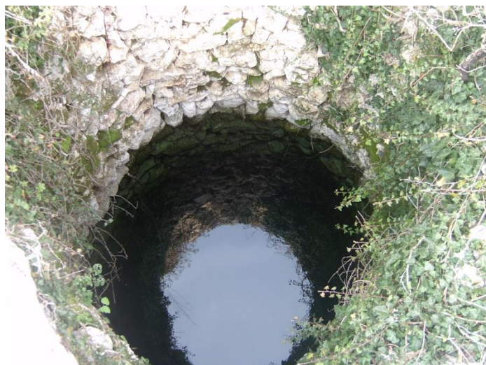
Slika. 1. Srednjovjekovni bunar Bistirna u Rasnu, Široki Brijeg

Ta mudrost je omogućavala život i preživljavanje na škrtom i kraškom području. Zdenci (bunari) su kopana mjesta u zemlji koji se grade na vodonosnom zemljištu, odnosno ispod kojih se nalaze glavni tokovi podzemnih voda, čvorišta podzemnih tokova voda, vodeni izvori i sl. Služe za vađenje vode i njihovo korištenje za piće, pranje, navodnjavanje. Kopani zdenac je obložen ili zidan kamenim blokovima kako bi onemogućio odron zemlje i zatrpavanje zdenca. Po tehnici zidanja, otkrivamo kojemu razdoblju zdenac pripada. Najljepši su oni iz antičkog razdoblja. Lica zidova su rađena od pravilno i uredno isklesanih blokova kamena, a u praznu srž zida nabacano je kamenje pomiješano s klačinom malterom. Prema načinu gradnje, najstariji zdenci pripisuju se grčkim i rimskim graditeljima, a najviše ih je iz antičkog i kasnoantičkog doba.