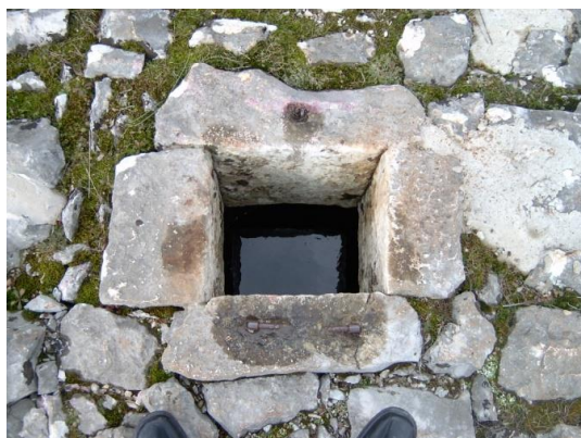
Slika 5. Otvor za čatrnju

Otvor, grlo ili kruna obično je na sredini čatrnje, a kroz njega se izvlači voda. Promjer otvora najčešće je 45 x 45 cm ili 50 x 50 cm. Grlo je nekih čatrnje od četiri uklesana i u krug ili u kvadrat posložena kamena, imenom vratnice. Vratnice nekih čatrnja imaju i svoj nadozidak, bucal . Bucal je obično izgrađivan na čatrnjama uz kuće, i to radi veće sigurnosti djece, a i odraslih. Stare čatrnje načelno imaju kamene bucale od četiri uklesana kamena ili od više sitnoga kamenja uzidanoga u zidiće. Bucali novijega datuma salijevani su od betona. Pri izradi bucala pazilo se na izgled. U lijepo uklesan kamen ukresavale su se razne figure te godine izgradnje.