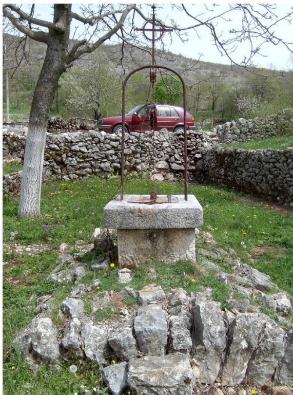
Slika 4. Kameni bucal, čatrnja na Rujnu, Široki Brijeg

kroz otvor na svodu. Čatrnje se povremeno, najčešće kad nestane vode, čiste od mulja koje voda naplavi. Ulazi se kroz otvor pomoću ljestava, konopca ili se spušta u kantama. Voda u čatrnjama čisti se i pomoću vapna. Na deset kubika vode uspe se otprilike pola kilograma živoga vapna. Vapno izgrize i pojede svu gamad u vodi. Mulj izbačen iz čatrnje nije plodan i ne služi ničemu.