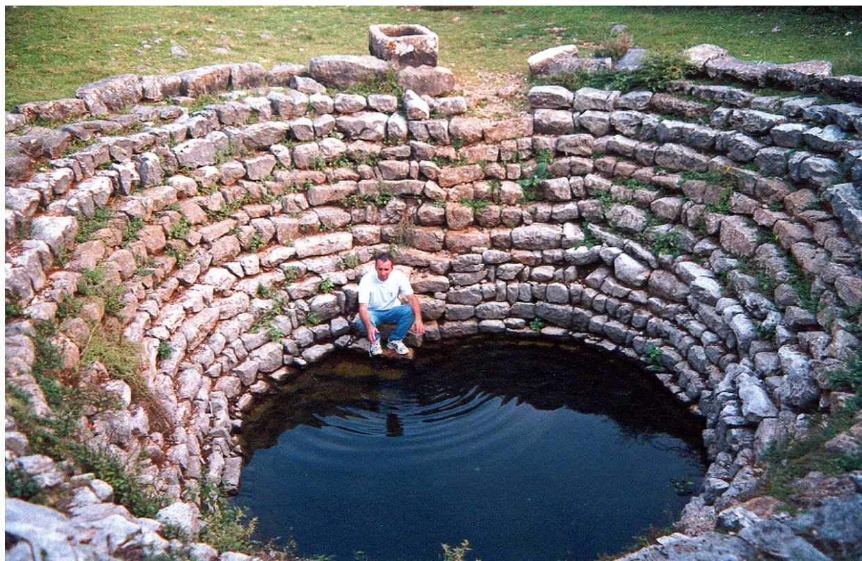
Slika 7. Lokva Niveš (Boljuni), Stolac

Lokve su različite prema obliku, dubini i površini. Većina ih je okrugla, promjera i preko dvadeset metara, a dubine od deset do petnaest metara. Neke su lokve ograđene kamenjem kako se tlo ne bi urušavalo. Između većega kamenja stavljala se škalja (sitno kamenje) kako bi obzida čvršće stajala. Pojedine su lokve podzidane suhozidom te opasane zidom s unutrašnje strane od uklesanoga kamena. Tim lokvama nisu prilazile životinje, a voda se koristila u domaćinstvu. U neke se lokve silazilo stubama što su se spuštale do dna. Uz neke lokve nalazila su se korita iz kojih se napajalo blago. U koritima se ponekad prala roba.