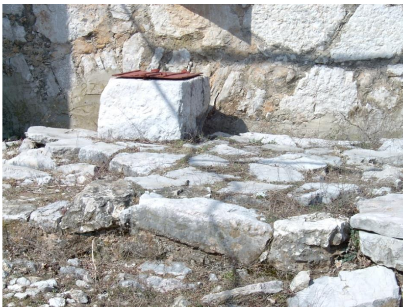
Slika 3. Čatrnja u blizini kuće, Grljevići, Ljubuški

njezina gornja površina pretvarala u lijepu terasu natkrivenu odrinom, koja je pružala i dodatnu zaštitu od sunca.