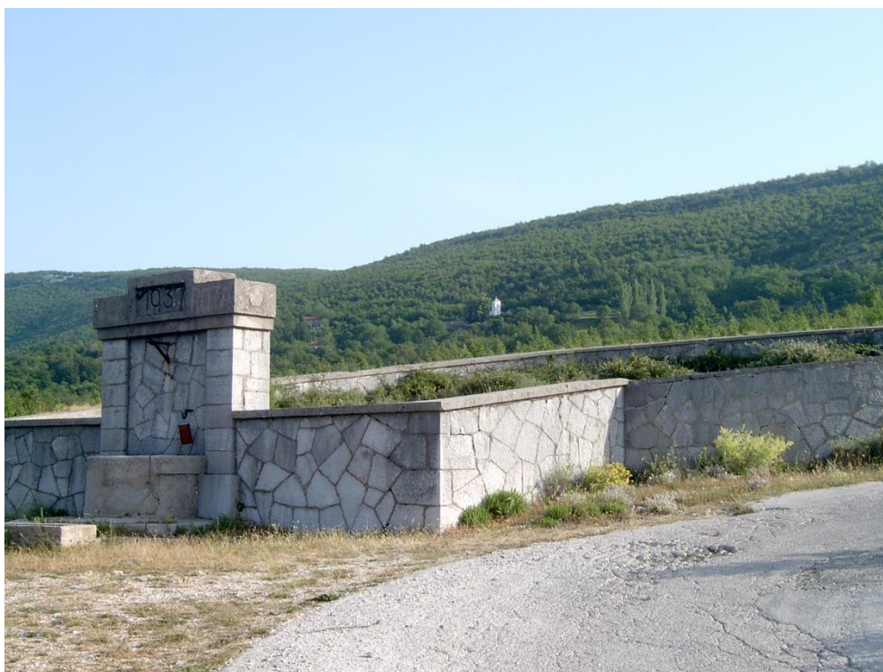
Slika 6. Zajednička čatrnja u selu Gornji Gradac

Neke od čatrnja u Hercegovini stare su više od stoljeća i izvorno su pučko blago. Nekad su se obvezno zaključavale i dobro čuvale. Jer, nestanak vode značio bi i nestanak života. Danas su stare čatrnje - znak i svjedočanstvo jednoga razdoblja i života.