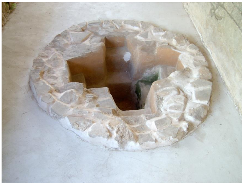
Slika 2. Krstionica u starokršćanskoj crkvi u Gorici, Grude

Baptisterion ili baptisterium je grčko-latinska riječ koju prevodimo riječju krstionica ili pohrvaćujemo riječju baptisterij. Naime, to je kapelica ili prostor s piscinom (zdenac za vodu) u kojoj se krštavalo. Najzanimljiviji prostor, u svakoj kršćanskoj crkvi, osobito kada je riječ o starokršćanskoj bazilici. U Hercegovini je otkriven veći broj krsnih zdenaca, unatoč zubu vremena, vrlo dobro su očuvani.