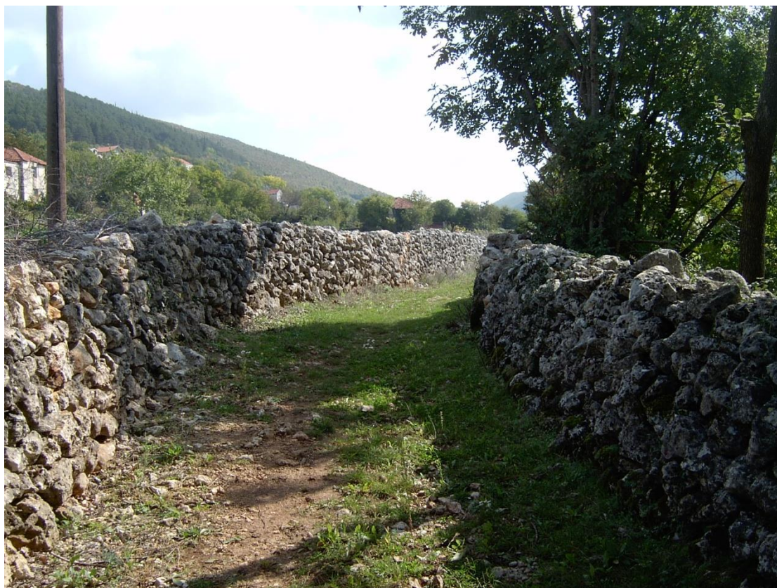
Slika 10. Suhozid

Zahvaljujući posebnoj mikroklimi suhozidi pružaju uvjete za opstanak raznim, osobito termofilnim vrstama formirajući tako brojna staništa. Površine suhozida prekrivaju mahovine i lišajevi dok u pukotinama zidova rastu posebne biljne zajednice divlje flore; istovremeno su važna staništa za kukce, gmazove i vodozemce te neke vrste ptica. Zbog svoje linearne strukture suhozidi su značajno obilježje ekološke mreže u poljoprivrednom krajobrazu te služe kao koridori kroz koje se kreću različite životinjske vrste.